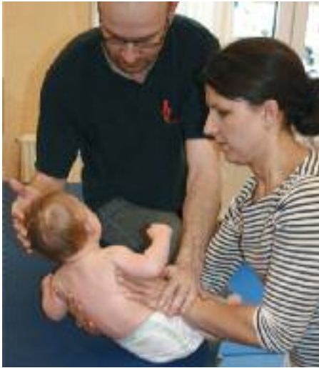
Abb. 3_Den Eltern werden gerade zu Beginn der Therapie die wichtigen Elemente aus dem Handling nach Bobath gezeigt

Auch das Handling nach Bobath muss von den Eltern in den Alltag eingebaut werden (Abb. 3). Es ist beispielsweise nicht sinnvoll, einen sich überstreckenden Säugling beim Hochheben aus der Rückenlage so aufzunehmen, dass der Kopf immer nach hinten fällt und dabei die Moro-Reaktion (siehe Glossar) ausgelöst wird.