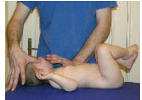
Abb. 2_Das Kind arbeitet mit dem Therapeuten in der 1. Phase Reflexumdrehen aus dem Vojta-Konzept

Aber ist es nicht genau das, was die angehenden Kindertherapeuten in den Kursen lernen? Sicherlich werden dort Techniken vermittelt, die dazu dienen,